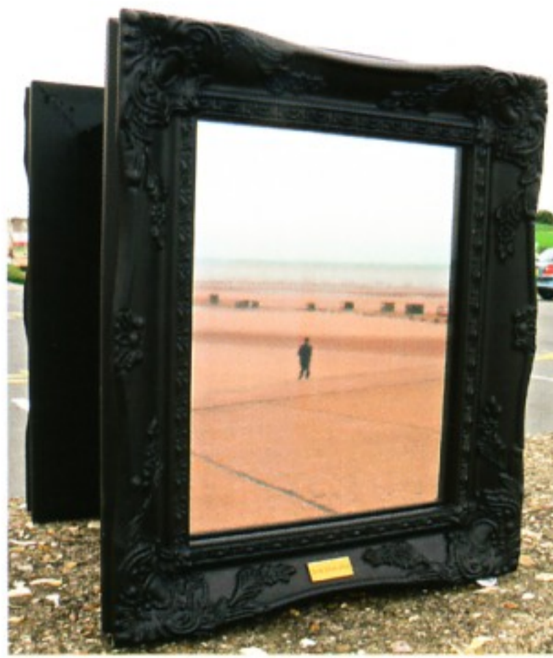
Feix&Merlin: Eyes Wide sHut