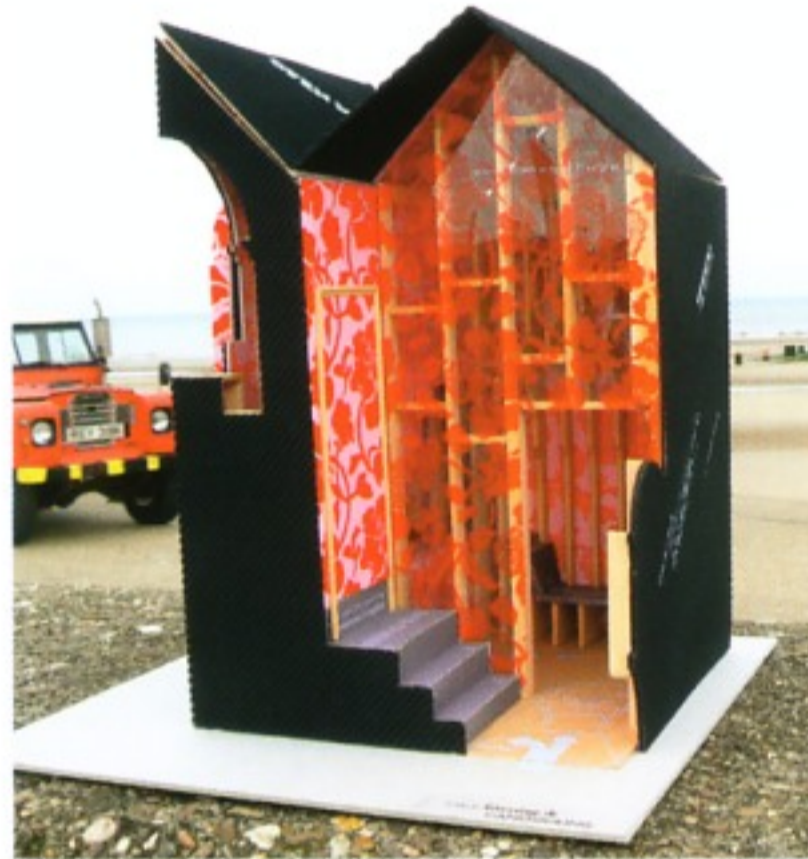
we made that: „Gazing and Canoodling“