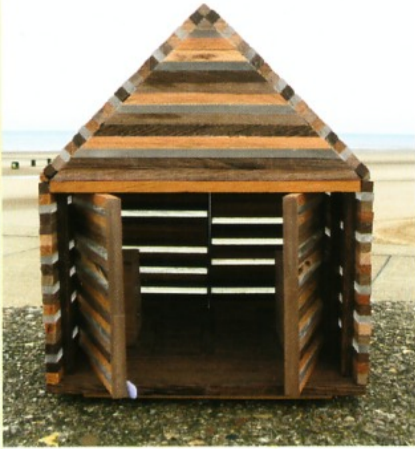
Atelier NU: Halcyon Beach Hut

Wie sieht die Strandhütte des 21. Jahrhunderts aus? Diese Frage stand im Mittelpunkt eines weltweiten Wettbewerbs, den die britische Grafschaft Lincolnshire ausgerufen hatte. Ziel des Wettbewerbs war, einem vom Tourismus vernachlässigten Küstenabschnitt zwischen den Städtchen Mablethorpe und Chapel St. Leonards mithilfe geballter Architektenkreativität neues Leben einzuhauchen. Die traditionelle Form der Strandhütte sollte von Architekten und Künstlern aus aller Welt überdacht und in eine zukunftsfähige Form auf eine Grundfläche von 3 x 3 Metern gebracht werden. Unter 240 Einreichungen gingen nun die Entwürfe der Büros Atelier NU (Montreal), Feix&Merlin (London), i-am associates (London) und we made that (London) als Sieger hervor. Bei den Entwürfen handelt es sich jedoch keineswegs um reine Fingerübungen, denn die vier Siegerentwürfe sollen im kommenden Jahr tatsächlich in großer Zahl gebaut und an Strandgäste vermietet werden. Nähere Infos unter www.bathingbeauties.org.uk .