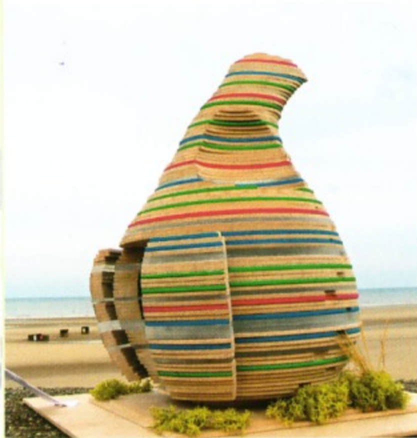
i-am associates: Jabba